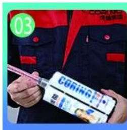
03 Abrir y ver, ambos lados pueden extrairse mientras tanto.