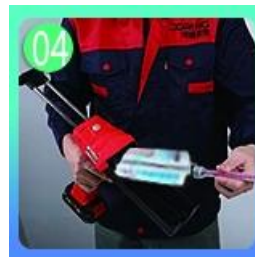
04 Atornille la boquilla, colóquela en la pistola de lechada.