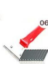
06 Perching Knife