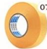
07 Masking Tape