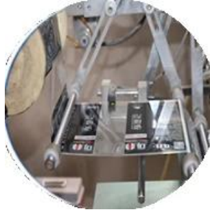
Máquina recubierta con película