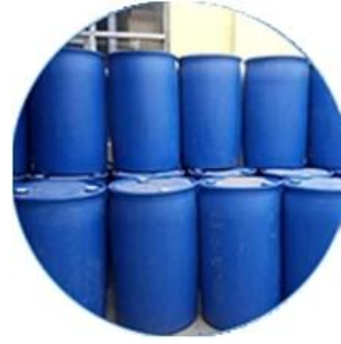
Valores material real