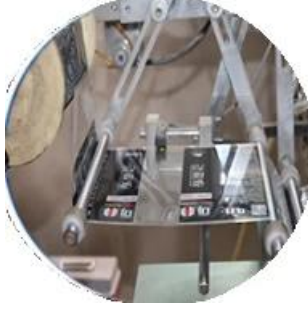
Máquinas y aparatos para máquinas de películas