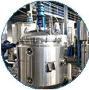
Línea de máquinas para máquinas de formar espuma