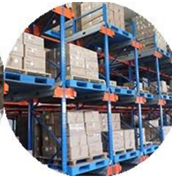
Material material real