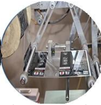
Máquina recubierta de película