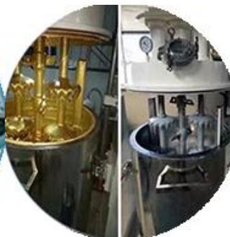
Línea de producción de lotes