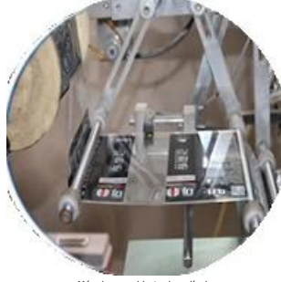
Máquina recubierta de película