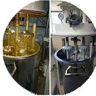
Línea de producción de lotes