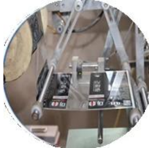
Máquina recubierta con película