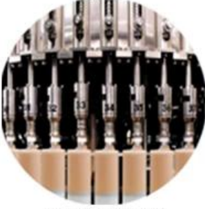
Filling Machine Line