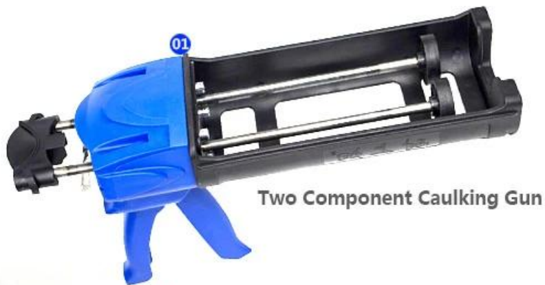
Two Component Caulking Gun