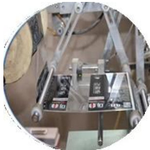
Máquina recubierta de película