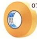
07 Masking Tape