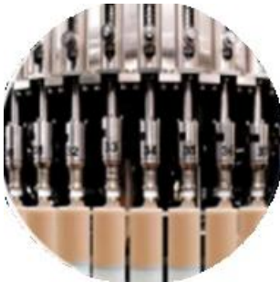
Línea de la máquina de llenado