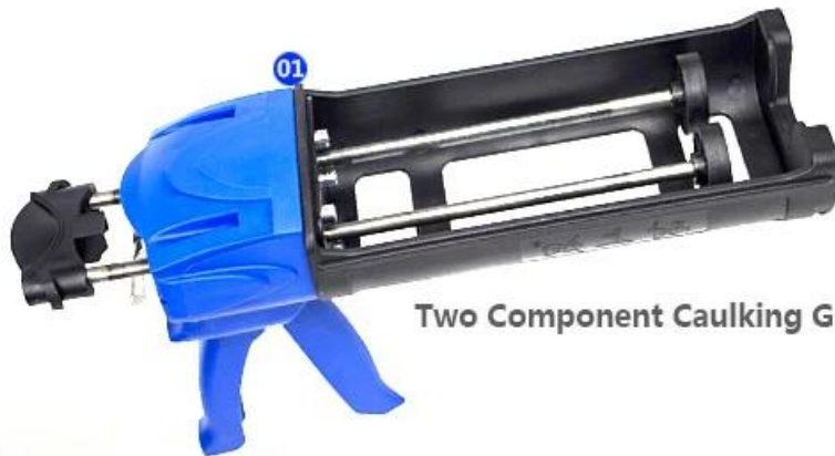
Two Component Caulking Gun