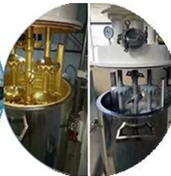
Línea de producción de lotes