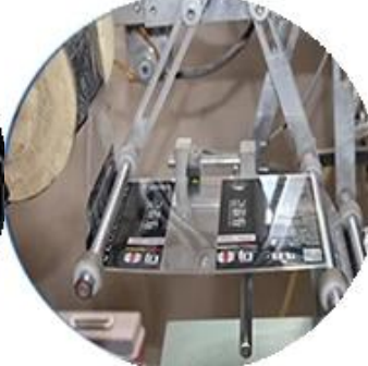
Máquina recubierta de película