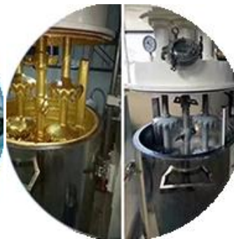
Línea de producción de lotes