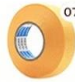
07 Masking Tape