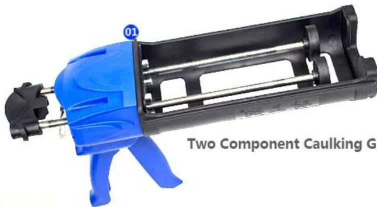
Two Component Caulking Gun