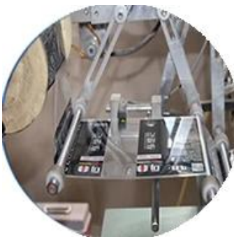
Máquina recubierta de película