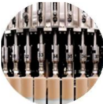
Línea de la máquina de llenado