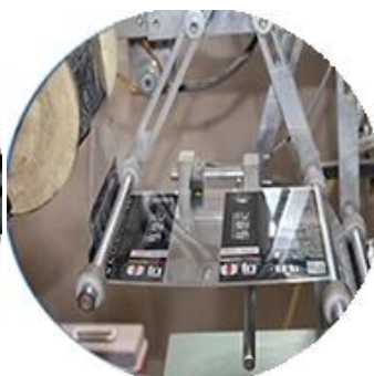
Máquina recubierta de película