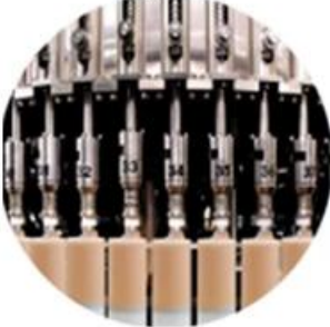
Filling Machine Line