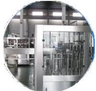
Archivado de enfriamiento