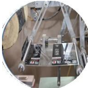
Máquina recubierta con película