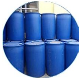
Valores material real