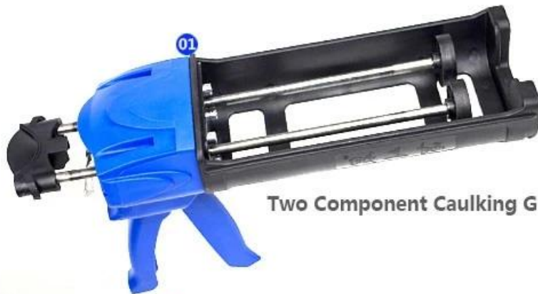
Two Component Caulking Gun