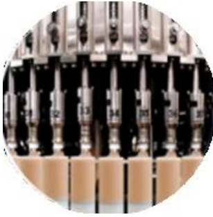
Línea de la máquina de llenado