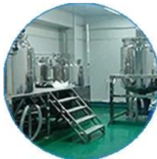
Máquina de pruebas