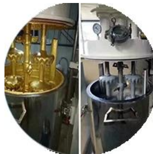
Línea de producción de lotes