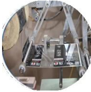
Máquina recubierta de película