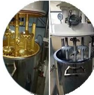
Línea de producción de lotes