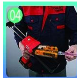
04 Atornille la boquilla, colóquela en la pistola de lechada.