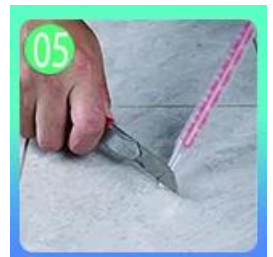
05 Corte inclinado la parte superior de la boquilla en 45 °.