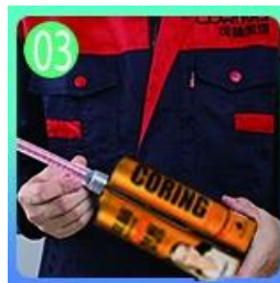
03 Abrir y ver, ambos lados pueden extruirse mientras tanto.