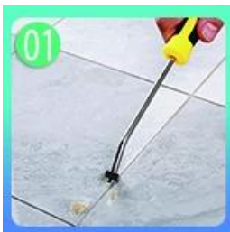
01 Limpie las baldosas y manteniéndola seca.