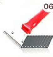
06 Perching Knife