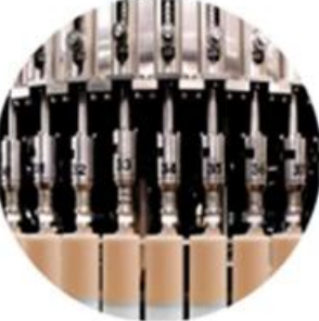
Filling Machine Line