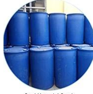
Raw Material Stock