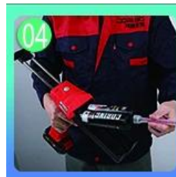
04 Atornille la boquilla, colóquela en la pistola de lechada.