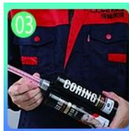
03 Abrir y ver, ambos lados pueden extruirse mientras tanto.