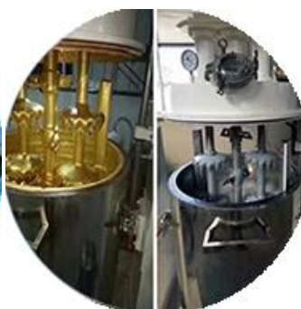
Línea de producción de lotes