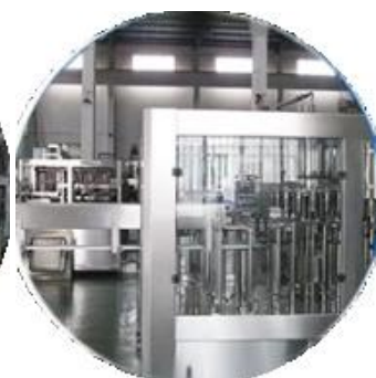
Archivo de enfriamiento