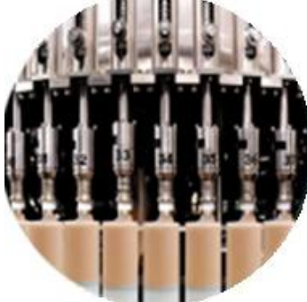
Línea de la máquina de llenado