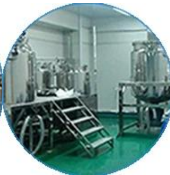
Maquina de pruebas