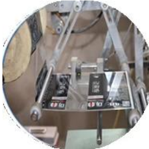
Máquinas y aparatos para máquinas de películas