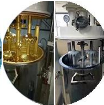
Línea de producción de lotes