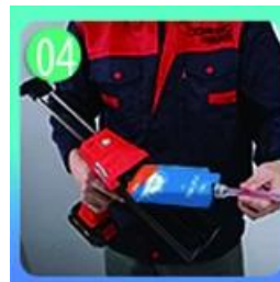
04 Atornille la boquilla, colóquela en la pistola de lechada.