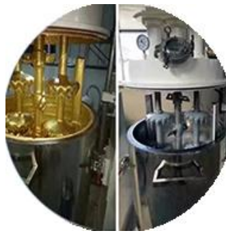
Línea de producción de lotes