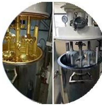
Línea de producción de lotes